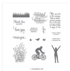
Enjoy Life Photopolymer Stamp Set - 148190