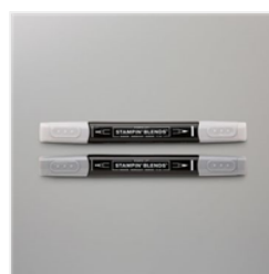
Stampin Blends Smoky Slate Combo Pack - 145058