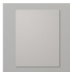
Gray Granite 8- 1/2" X 11" Cardstock - 146983