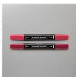
Cherry Cobbler Stampin' Blends Combo Pack - 144598