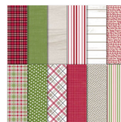
Festive Farmhouse 12" X 12" (30.5 X 30.5 Cm) Designer Series Paper - 147820