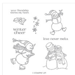
Spirited Snowmen Clear-Mount Stamp Set - 148072