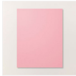
Pretty In Pink 8- 1/2" X 11" Cardstock - 163793