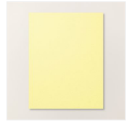
Lemon Lolly 8-1/2" X 11" Cardstock - 161720