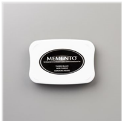
Tuxedo Black Memento Ink Pad - 132708