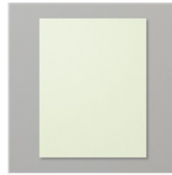
Soft Sea Foam 8- 1/2" X 11" Cardstock - 146988