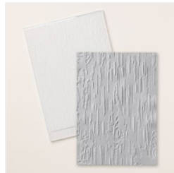
Birch Wood 3D Embossing Folder - 164069