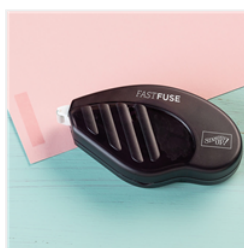
Fast Fuse Adhesive - 129026