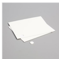
Stampin' Dimensionals - 104430