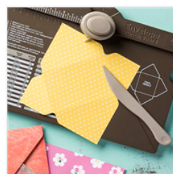
Envelope Punch Board - 133774