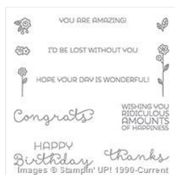
Cottage Greetings Clear-Mount Stamp Set - 139962