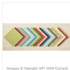
Pretty Petals Designer Series Paper Stack - 138442