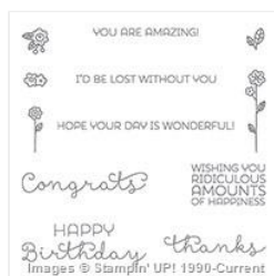
Cottage Greetings Wood-Mount Stamp Set - 138940