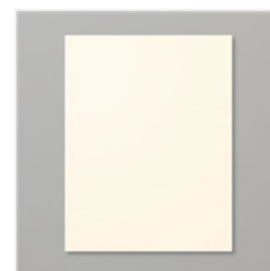
Very Vanilla 8-1/2" X 11" Cardstock - 101650