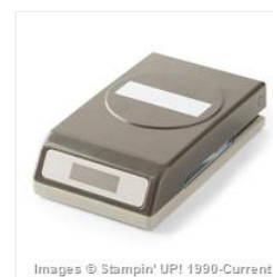
Washi Label Punch - 138296