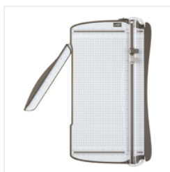
Stampin' Trimmer - 126889