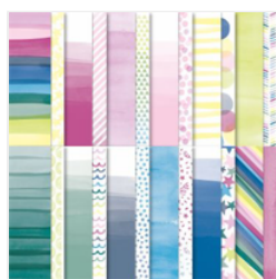
Bright & Beautiful 6\" X 6\" (15.2 X 15.2 Cm) Designer Series Paper - 161449

stampwithtammy@gmail.com http://tammyfite.stampinup.net