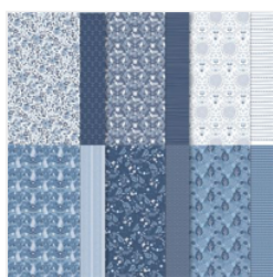
Countryside Inn 12\" X 12\" (30.5 X 30.5 Cm) Designer Series Paper - 161467