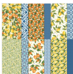
Mediterranean Blooms 12\" X 12\" (30.5 X 30.5 Cm) Designer Series Paper - 163284