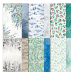
Winter Meadow 12\" X 12\" (30.5 X 30.5 Cm) Designer Series Paper - 162133