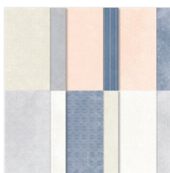
Country Lace 12\" X 12\" (30.5 X 30.5 Cm) Designer Series Paper - 163415