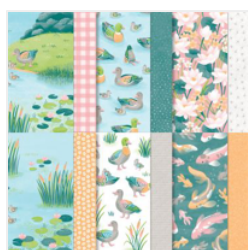
Lily Pond Lane 6\" X 6\" (15.2 X 15.2 Cm) Designer Series Paper - 163342