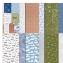
Take To The Sky 12\" X 12\" (30.5 X 30.5 Cm) Designer Series Paper - 163436