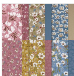
Wildly Flowering 12\" X 12\" (30.5 X 30.5 Cm) Designer Series Paper - 163323