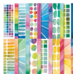
Full Of Life 6\" X 6\" (15.2 X 15.2 Cm) Designer Series Paper - 163357