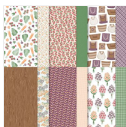
To Market 12\" X 12\" (30.5 X 30.5 Cm) Designer Series Paper - 163421