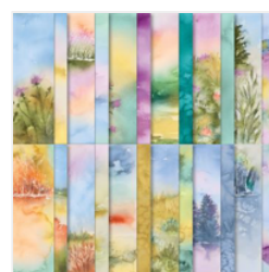
Thoughtful Journey 6\" X 6\" (15.2 X 15.2 Cm) Designer Series Paper - 163303