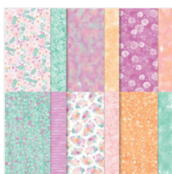
Unbounded Beauty 12\" X 12\" (30.5 X 30.5 Cm) Designer Series Paper - 163372