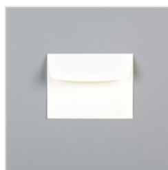
Very Vanilla Medium Envelopes - 107300 Price: $8.50