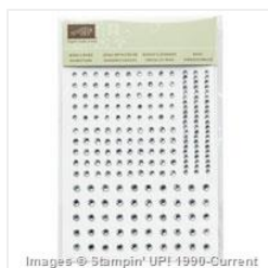
Rhinstone Basic Jewels - 119246 Price: $5.00