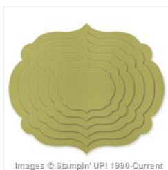
Labels Collection Framelits Die - 125598 Price: $26.95