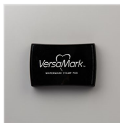
VersaMark Pad - 102283 Price: $9.50