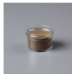
Gold Stampin' Emboss Powder - 109129 Price: $6.00