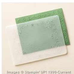
Filigree Frame Textured Impressions Embossing Folders - 135818 Price: $7.95