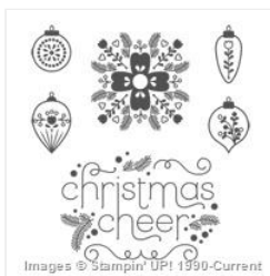
Cheerful Christmas Clear-Mount Stamp Set - 135149 Price: $17.95