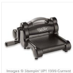
Big Shot - 113439 Price: $110.00