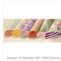
Color Me Autumn Designer Series Paper - 135820