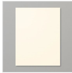
Very Vanilla 8-1/2\" X 11\" Cardstock - 101650