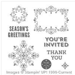
Letterpress Winter Photopolymer Stamp Set - 135143