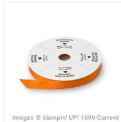
Tangelo Twist 3/8\" Satin Stitched Ribbon - 133669