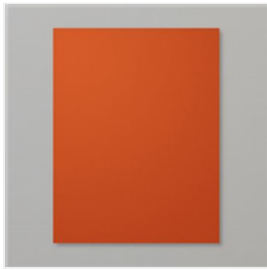
Cajun Craze 8-1/2\" X 11\" Cardstock - 119684