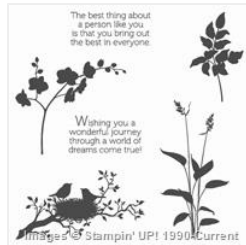
World Of Dreams Clear-Mount Stamp Set - 134186