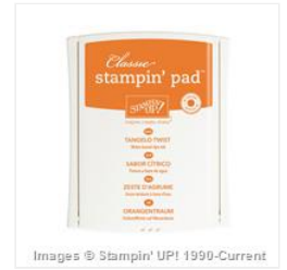
Tangelo Twist Classic Stampin' Pad - 133646