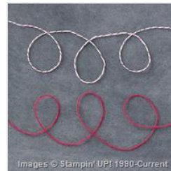
Candy Cane Lane Baker's Twine - 141983