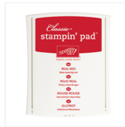
Real Red Classic Stampin' Pad - 126949