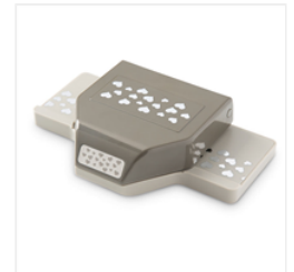
Confetti Hearts Border Punch - 137415