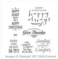
Suite Seasons Clear-Mount Stamp Set - 142209

candy@sweetstamper.com http://sweetstamper.com