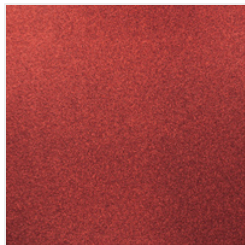
Red Glimmer Paper - 121790