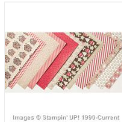
Candy Cane Lane Designer Series Paper - 141981