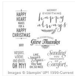
Suite Seasons Wood-Mount Stamp Set - 142206