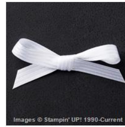
Whisper White 3/8" Stitched Satin Ribbon - 138429 Price: $9.00