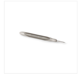
Paper-Piercing Tool - 126189 Price: $4.00