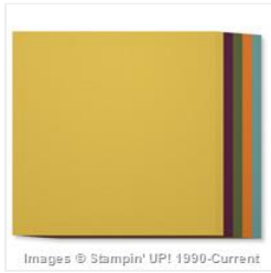
2014-2016 In Color 12" X 12" Cardstock - 133680 Price: $10.00