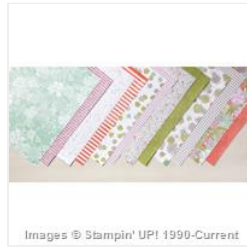
Succulent Garden Designer Series Paper - 147363 Price: $0.00