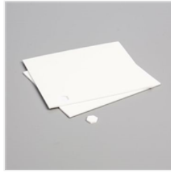
Stampin' Dimensionals - 104430