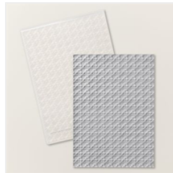
3-D-Prägeform Rattan-Geflecht - 160580