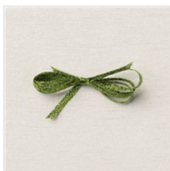
1/8" (3.2 Mm) Gewebtes Metallic- Band In Papageiengrün - 159196