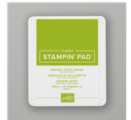
Klassisches Stempelkissen In Grüner Apfel - 147095