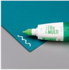
Mehrzweck- Flüssigkleber - 154974

Christine Wöhr 015162608746 info@abgestempelt.net abgestempelt.net