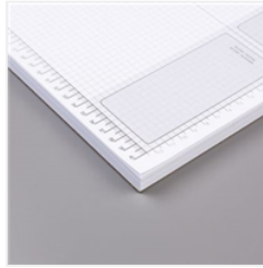
Kariertes Papier - 130148