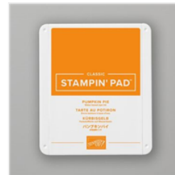
Klassisches Stempelkissen In Kürbisgelb - 147086