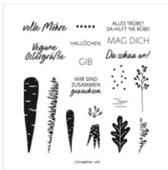
Stempelset Klarsicht Volle Möhre (Deutsch) - 160820

Christine Wöhr 015162608746 info@abgestempelt.net abgestempelt.net