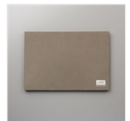
Stempel- Und Perforiermatte - 126199