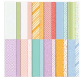
Designerpapier 12" X 12" (30.5 X 30.5 Cm) Fröhliche Muster - 160836