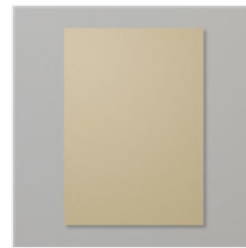
Farbkarton A4 Savanne - 121685