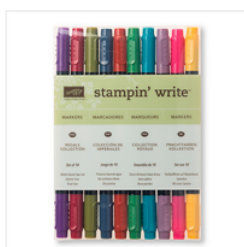
Regals Stampin' Write Markers - 131262