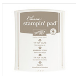
Tip Top Taupe Classic Stampin' Pad - 138325