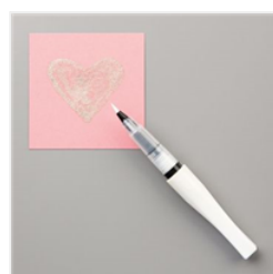
Wink Of Stella Clear Glitter Brush - 141897