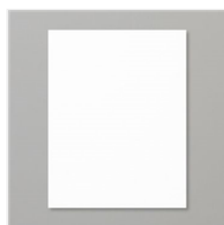
Whisper White 8- 1/2" X 11" Cardstock - 100730