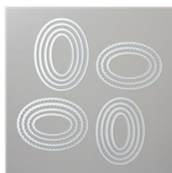
Layering Ovals Dies - 141706