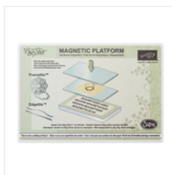
Magnetic Platform - 130658