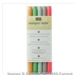
2015-2017 In Color Stampin' Write Markers - 138333