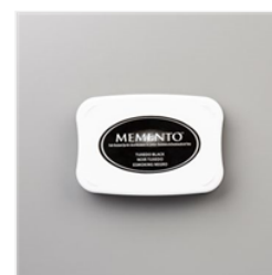
Tuxedo Black Memento Ink Pad - 132708