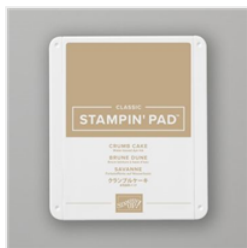
Crumb Cake Classic Stampin' Pad - 147116 Price: $11.00