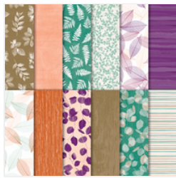
Nature's Poem Designer Series Paper - 146338 Price: $11.00