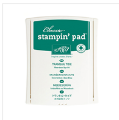
Tranquil Tide Classic Stampin' Pad - 144085 Price: $6.50