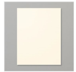
Very Vanilla 8-1/2" X 11" Cardstock - 101650 Price: $13.00