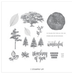
Rooted In Nature Clear-Mount Stamp Set - 146482 Price: $42.00

lennyandmary1@msn.com www.maryblocher.stampinup.net