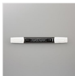
Stampin' Blends Color Lifter - 144608