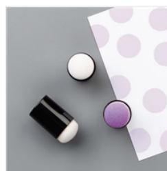
Sponge Daubers - 133773