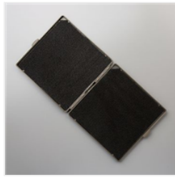
Stampin' Scrub - 126200