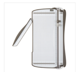
Stampin' Trimmer - 126889