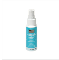
Stampin' Mist - 102394