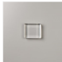
Clear Block C - 118486