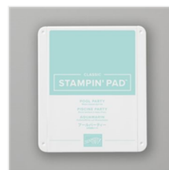
Pool Party Classic Stampin' Pad - 147107