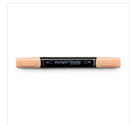
Pumpkin Pie Light Stampin' Blends Marker - 144578