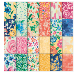
Garden Impressions 6" X 6" (15.2 X 15.2 Cm) Designer Series Paper - 146289