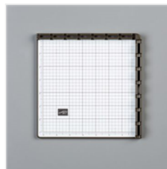
Stamparatus - 146276