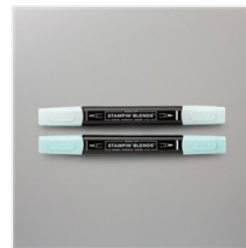
Pool Party Stampin' Blends Combo Pack - 144605