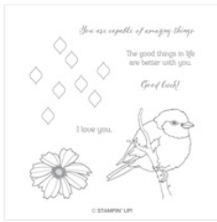
Better With You Clear-Mount Stamp Set - 146567