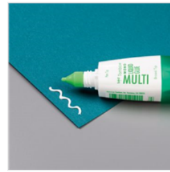
Multipurpose Liquid Glue - 110755