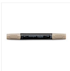
Crumb Cake Dark Stampin' Blends Marker - 144581