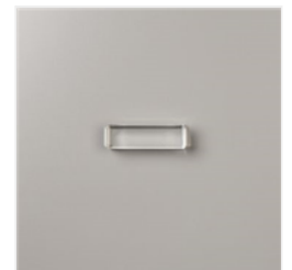
Clear Block G - 118489