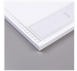
Grid Paper - 130148