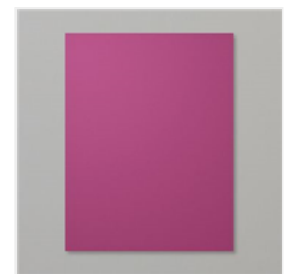
Rich Razzleberry 8-1/2" X 11" Cardstock - 115316