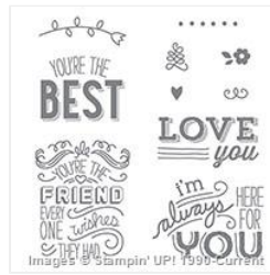
Friendly Wishes Wood-Mount Stamp Set - 138698