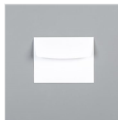
Whisper White Medium Envelopes - 107301