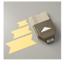
Triple Banner Punch - 138292