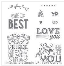
Friendly Wishes Clear-Mount Stamp Set - 139579