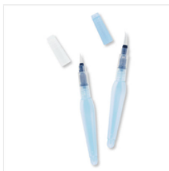
Aqua Painters - 103954