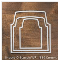
Envelope Liners Framelits Dies - 132172