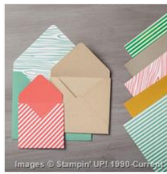
2015-2017 In Color Envelope Paper (Stripes) - 138312