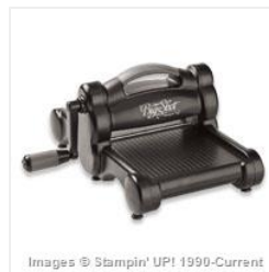
Big Shot - 113439