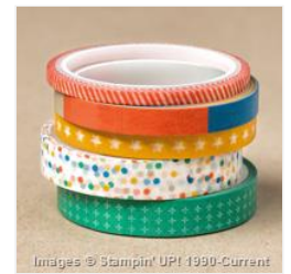
Party Animal Designer Washi Tape - 147362