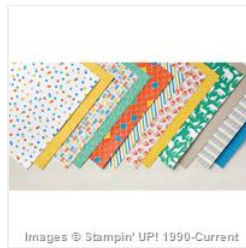
Party Animal Designer Series Paper - 147365