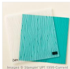
Seaside Textured Impressions Embossing Folder - 147360