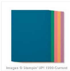
2016-2018 In Color A4 Cardstock - 147366

http://www.stampinup.net/esuite/home/rhein-main/