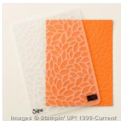
Petal Burst Textured Impressions Embossing Folder - 147359