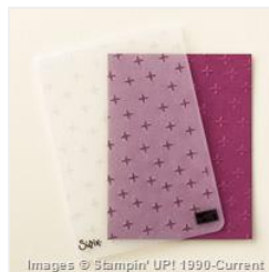
Sparkle Textured Impressions Embossing Folder - 147356