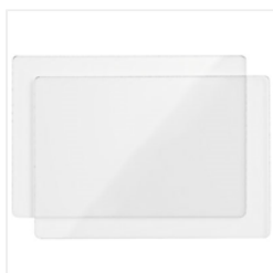
Standard Cutting Pads - 113475