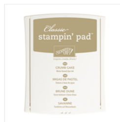
Crumb Cake Classic Stampin' Pad - 126975