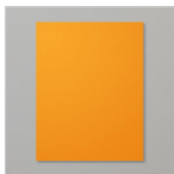
Pumpkin Pie 8-1/2\" X 11\" Cardstock - 105117