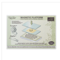
Magnetic Platform - 130658