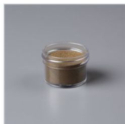
Gold Stampin' Emboss Powder - 109129