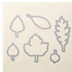
Leaflets Framelits Dies - 138283