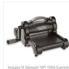
Big Shot - 113439