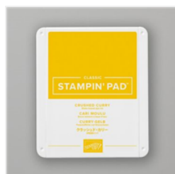
Tampon Encreur Classic Cari Moulu - 147087