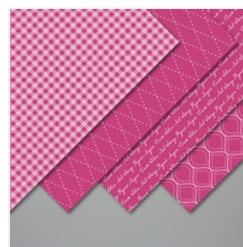
Brights 6" X 6" (15.2 X 15.2 Cm) Designer Series Paper - 149613