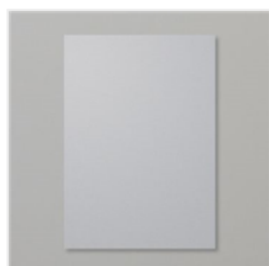
Papier Cartonné A4 Ardoise Bourgeoise - 131291