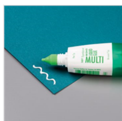
Multipurpose Liquid Glue - 110755