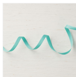
Bermuda Bay 1/4" (6.4 Mm) Mini Striped Ribbon - 146939