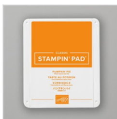
Tampon Encreur Classic Tarte Au Potiron - 147086