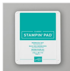
Tampon Encreur Classic Baie Des Bermudes - 147096