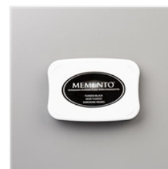
Tampon Encreur Memento Noir Tuxedo - 132708