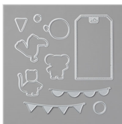
Bonanza Dies - 151566