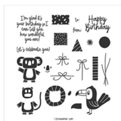
Bonanza Buddies Photopolymer Stamp Set - 151567