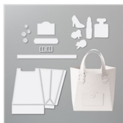
Poinçons Beaux Atours - 151665