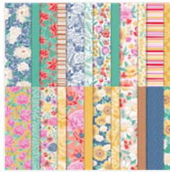
Designerpapier Blumen Für Jede Jahreszeit - 152486 Price: € 14,00