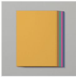
Farbkartonset A4 In Color 2020-2022 - 153075 Price: € 11,00