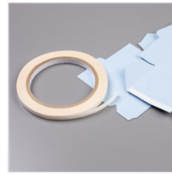
Abreiss-Klebeband - 138995 Price: € 8,50