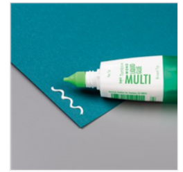
Mehrzweck- Flüssigkleber - 154974 Price: € 8,00