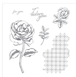
Graceful Garden Wood-Mount Stamp Set - 143846