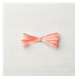
Calypso Coral 1/4" Ombre Ribbon - 144235