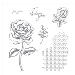
Graceful Garden Clear-Mount Stamp Set - 143849