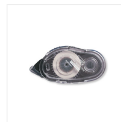
Snail Adhesive - 104332