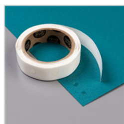
Mini Glue Dots - 103683