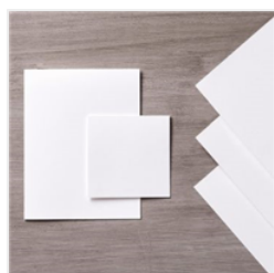
Whisper White 8- 1/2" X 11" Thick Cardstock - 140272