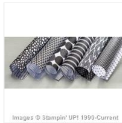
Back To Black Designer Series Paper - 133700