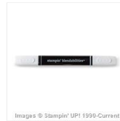
Stampin' Blendabilities® Alcohol Marker Color Lifter - 129369