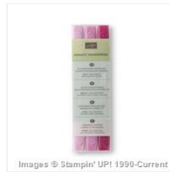
Stampin' Blendabilities™ Markers Rich Razzleberry Assortment - 131003