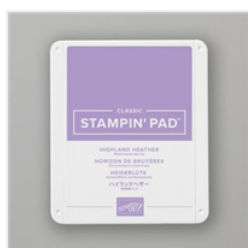
Highland Heather Classic Stampin' Pad - 147103