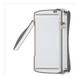
Stampin' Trimmer - 126889