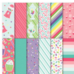
How Sweet It Is 12" X 12" (30.5 X 30.5 Cm) Designer Series Paper - 148568

stampwithmarybush@yahoo.com www.stampinthesand.stampinup.net