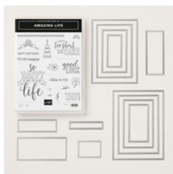
Amazing Life Photopolymer Bundle - 150624