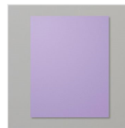
Highland Heather 8-1/2" X 11" Cardstock - 146986