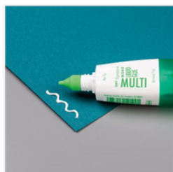
Multipurpose Liquid Glue - 110755