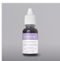
Highland Heather Classic Stampin' Ink Refill - 147167