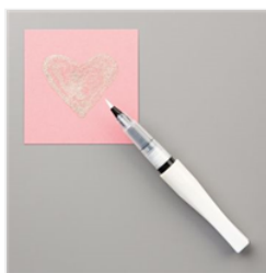
Wink Of Stella Clear Glitter Brush - 141897