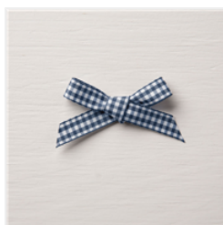
Night Of Navy 1/2" Gingham Ribbon - 144232