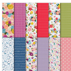
Needlepoint Nook 12" X 12" (30.5 X 30.5 Cm) Designer Series Paper - 148807