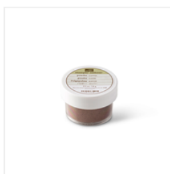
Copper Stampin' Emboss Powder - 141636