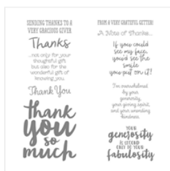
Thankful Thoughts Clear-Mount Stamp Set - 141522