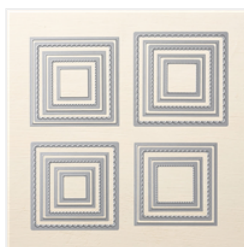
Layering Squares Dies - 141708