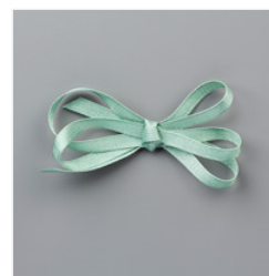
Mint Macaron 1/4" (6.4 Mm) Textile Ribbon - 149480