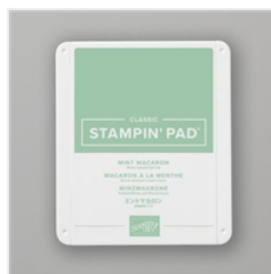
Tampon Encreur Classic Macaron À La Menthe - 147106