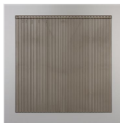
Grille De Marquage Système Métrique Simply Scored - 127531