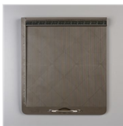
Grille De Marquage Simply Scored - 122334