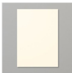
Papier Cartonné A4 Très Vanille - 106550