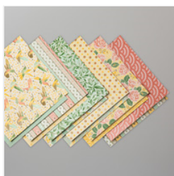
Mosaic Mood Specialty Designer Series Paper - 149478