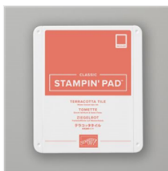
Tampon Encreur Classic Tomette - 150086