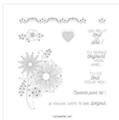
Set De Tampons Amovibles Un Peu De Dentelle (Fr) - 150140