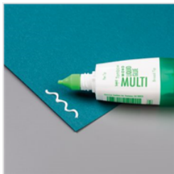
Mehrzweck- Flüssigkleber - 154974