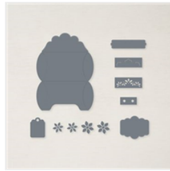
Stanzformen Kreative Kissenschachtel - 156321