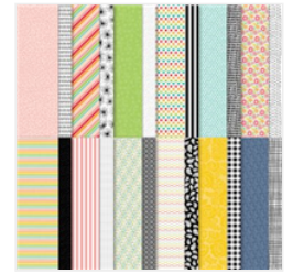
Designerpapier Gastgeber/In 12" X 12" (30.5 X 30.5 Cm) Mustermix - 155426