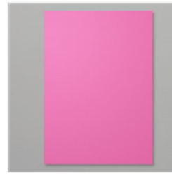
Farbkarton A4 Magentarot - 153085