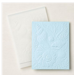
3-D-Prägeform Muschelreigen - 154309