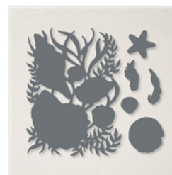
Stanzformen Meeresmuscheln - 156095