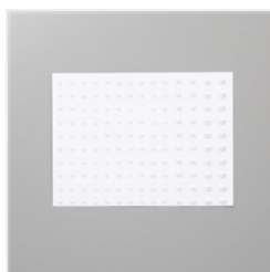
Basic Perlenschmuck - 144219