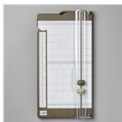
Papierschneidemaschine Stanz- Und - 152392