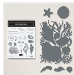
Produktpaket Wie Muscheln (Deutsch) - 156207