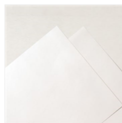
Spezialpapier Perlmutterglanz - 154291