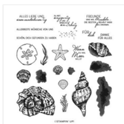
Stempelset Klarsicht Wie Muscheln (Deutsch) - 154372