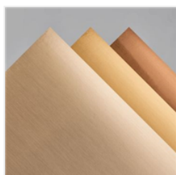
Farbkarton In Matt- Metallic - 153524