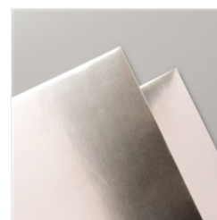
Metallic- Folienpapier In Champagner - 144748