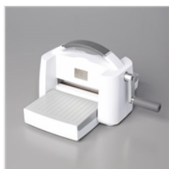
Stanz- Und Prägemaschine - 149653