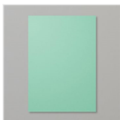
Farbkarton A4 Jade - 131302