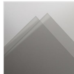
Papier Fenêtré - 142314