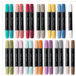
Stampin' Blends Markers Collection - 147475