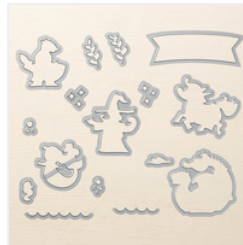
Magical Mates Framelits Dies - 145660