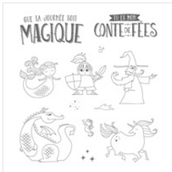
Journée Magique Clear-Mount Stamp Set (French) - 146400