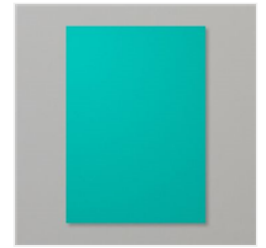
Papier Cartoné A4 Baie Des Bermudes - 131286