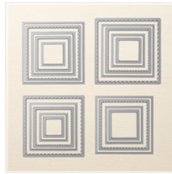
Layering Squares Dies - 141708