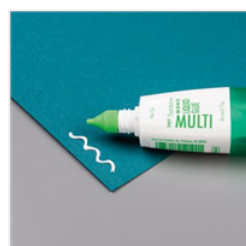
Multipurpose Liquid Glue - 110755