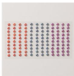
Adhesive-Backed Pearl Trio - 163319