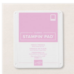
Fresh Freesia Classic Stampin' Pad - 155611