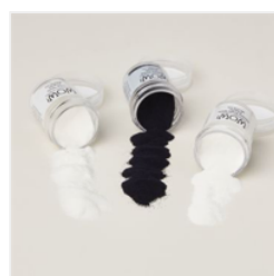
Basics Wow! Embossing Powder - 165679