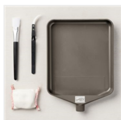
Embossing Additions Tool Kit - 159971