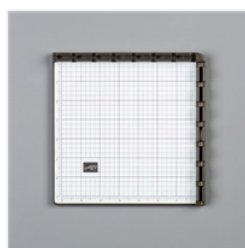
Stamparatus - 146276