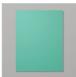
Just Jade 8-1/2" X 11" Cardstock - 153079