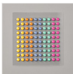
2020-2022 In Color Enamel Dots - 152480