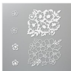
Many Layered Blossoms Dies - 153582