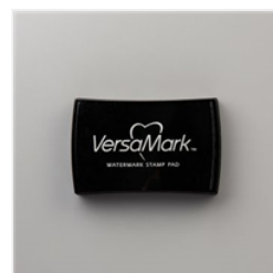
VersaMark Pad - 102283