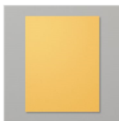
Bumblebee 8-1/2" X 11" Cardstock - 153077