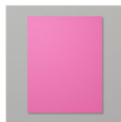
Magenta Madness 8-1/2" X 11" Cardstock - 153080