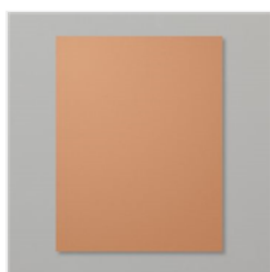
Cinnamon Cider 8-1/2" X 11" Cardstock - 153078