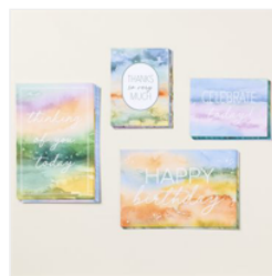
Thoughtful Journey Memories & More - 163318