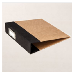
Basic Black 6" X 8" (15.2 X 20.3 Cm) Album - 163883