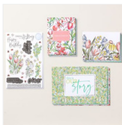
Mixed Media Florals Memories & More Card Pack - 164657