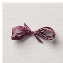
Fresh Fig 1/8" Sheer Ribbon - 144174