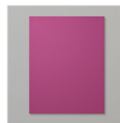
Rich Razzleberry 8-1/2" X 11" Cardstock - 115316