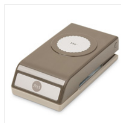
1-3/8" (3.5 Cm) Scallop Circle Punch - 146139