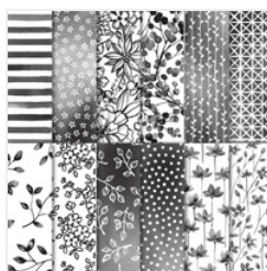
Petal Passion Designer Series Paper - 145589