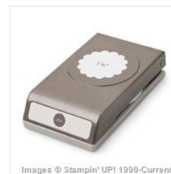
1-3/4" Scallop Circle Punch - 119854