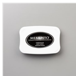
Tuxedo Black Memento Ink Pad - 132708