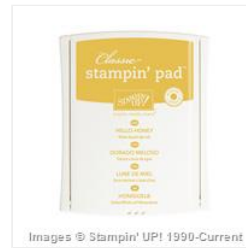
Hello Honey Classic Stampin' Pad - 133643