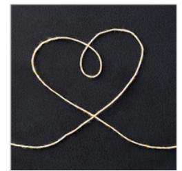
Crushed Curry Baker's Twine - 134586