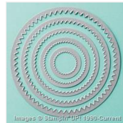
Starburst Framelits Die - 132967