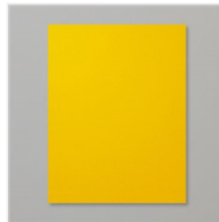
Crushed Curry 8- 1/2" X 11" Cardstock - 131199