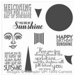
Ray Of Sunshine Wood-Mount Stamp Set - 134339