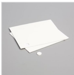
Stampin' Dimensionals - 104430