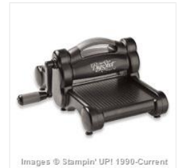
Big Shot - 113439