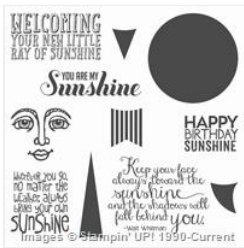
Ray Of Sunshine Clear-Mount Stamp Set - 134210