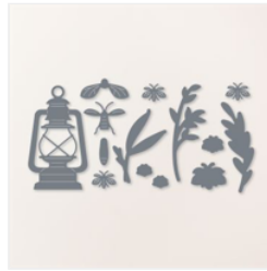
Stanzformen Heimeliges Licht - 160496