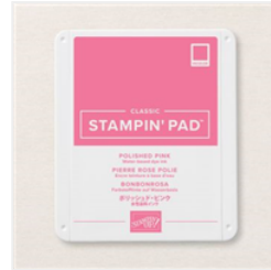
Klassisches Stempelkissen In Bonbonrosa - 155712