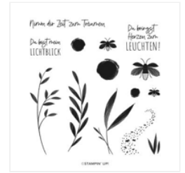
Stempelset Klarsicht Heimeliges Licht (Deutsch) - 160870