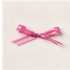
3/8\" (1 Cm) Locker Gewebtes Geschenkband In Bonbonrosa - 155714