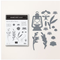
Produktpaket Heimeliges Licht (Deutsch) - 160498

katja@machsdirschoen.info www.machsdirschoen.info