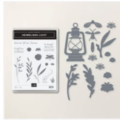
Produktpaket Heimeliges Licht (Deutsch) - 162382