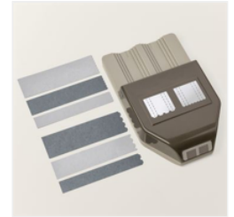
Stanze Nach Wahl Fröhliche Etiketten - 160693