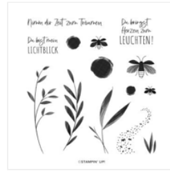
Stempelset Ablösbar Heimeliges Licht (Deutsch) - 160494