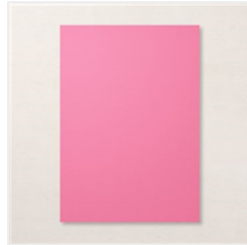
Farbkarton A4 Bonbonrosa - 155711