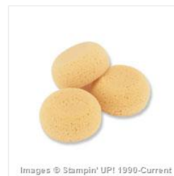
Stamping Sponges - 101610 Price: $4.50