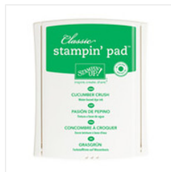
Cucumber Crush Classic Stampin' Pad - 138324 Price: $8.50