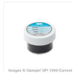
Black Stampin' Emboss Powder - 109133 Price: $6.25