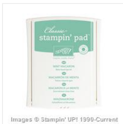
Mint Macaron Classic Stampin' Pad - 138326 Price: $8.50