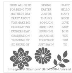
Crazy About You Photopolymer Stamp Set - 137137 Price: $31.00