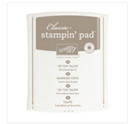
Tip Top Taupe Classic Stampin' Pad - 138325 Price: $8.50