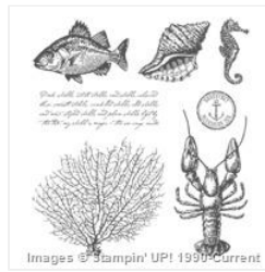
By The Tide Clear- Mount Stamp Set - 129120 Price: $25.00