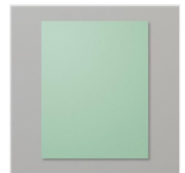
Mint Macaron 8- 1/2" X 11" Cardstock - 138337 Price: $12.75