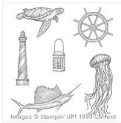
From Land To Sea Clear-Mount Stamp Set - 139361 Price: $25.00