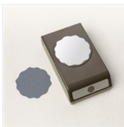
Decorative Circle Punch - 159174