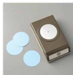
2" (5.1 Cm) Circle Punch - 133782