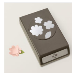
Petal Park Builder Punch - 160576