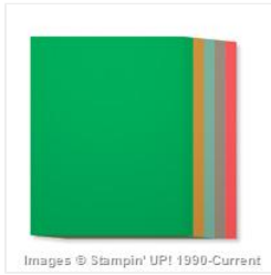
2015-2017 In Color 8-1/2" X 11" Cardstock - 138339 Price: $8.00