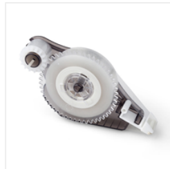
Fast Fuse Adhesive Refill - 129027 Price: $7.50