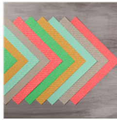
2015-2017 In Color Envelope Paper (Circles & Dots) - 141697 Price: $11.00