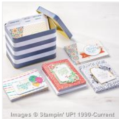
Designer Tin Of Cards Project Kit - 141651 Price: $27.00