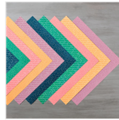
2016-2018 In Color Envelope Paper - 141698 Price: $11.00