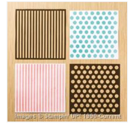
Dots & Stripes Decorative Masks - 133775 Price: $3.00