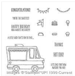
Tasty Trucks Photopolymer Stamp Set - 143300

Cindee Wilkinson 925-325-8266 cindeewilkinson@comcast.net www.justspongeit.com