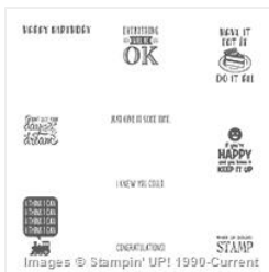
Designer Tee Clear-Mount Stamp Set - 143359