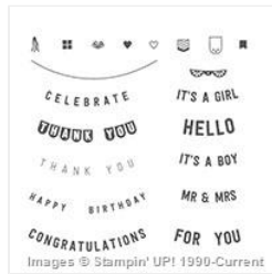
Any Occasion Photopolymer Stamp Set - 143348