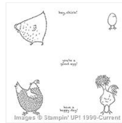
Hey Chick Clear Mount Stamp Set - 143331