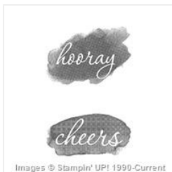
Reverse Words (Clear) - 143319 Price: $0.00