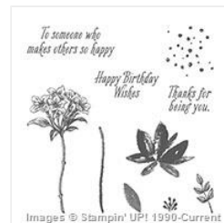
Avant Garden Photopolymer Stamp Set - 143272 Price: $0.00