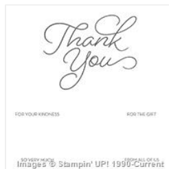
So Very Much Clear-Mount Stamp Set - 143343 Price: $0.00