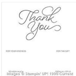
So Very Much Wood-Mount Stamp Set - 143340 Price: $0.00