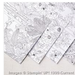
Inside The Lines Designer Series Paper - 143830 Price: $0.00