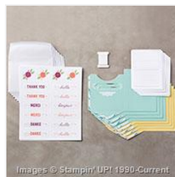
Pretty Pocket Card Kit - 143832