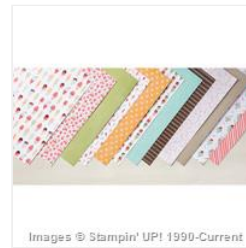
Tasty Treats Specialty Designer Series Paper - 147364 Price: $0.00