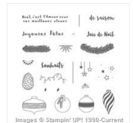
Affaire De Conifères Photopolymer Stamp Set (French) - 143022 Price: $17.00