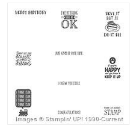
Designer Tee Wood-Mount Stamp Set - 143356