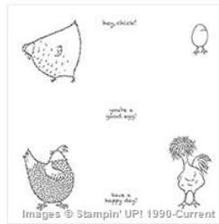
Hey Chick Wood- Mount Stamp Set - 143328