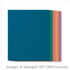
2016-2018 In Color 8-1/2" X 11" Cardstock - 147361 Price: $0.00