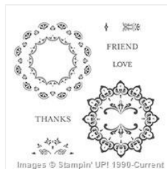
Make A Medallion (Photopolymer) - 143274 Price: $0.00