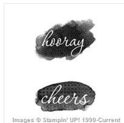
Reverse Words (Wood) - 143316 Price: $0.00