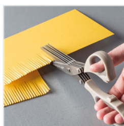
Fringe Scissors - 133325