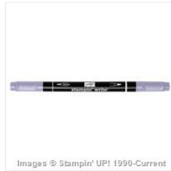
Wisteria Wonder Stampin' Write Marker - 131903