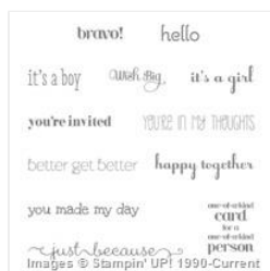
A Dozen Thoughts Clear-Mount Stamp Set - 131059

cindicopeland@comcast.net cindicopeland.stampinup.net