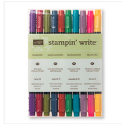
Regals Stampin' Write Markers - 131262