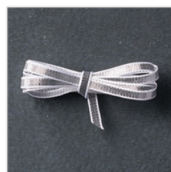
Silver 1/8" (3.2 Mm) Ribbon - 132137