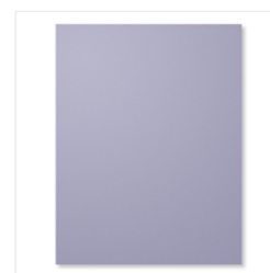
Wisteria Wonder 8- 1/2" X 11" Cardstock - 122922