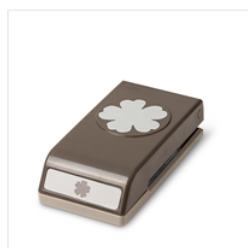
Pansy Punch - 130698