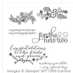
For The New Two Clear-Mount Stamp Set - 138562