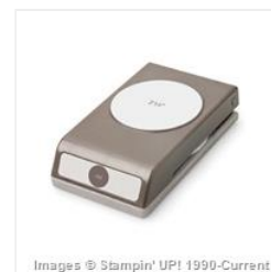
2-1/2" Circle Punch - 120906