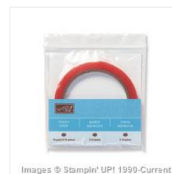
Sticky Strip - 104294