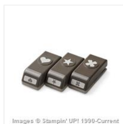
Itty Bitty Accents Punch Pack - 133787