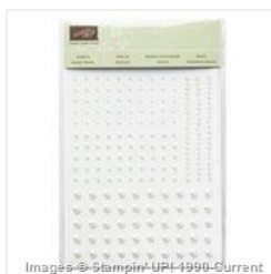
Pearl Basic Jewels - 119247