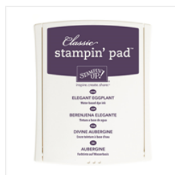
Elegant Eggplant Classic Stampin' Pad - 126969