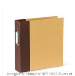
Espresso 6" X 8" (15.2 X 20.3 Cm) Project Life Album - 135293