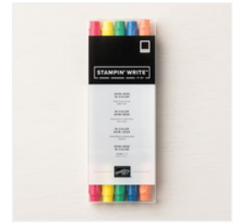
In Color 2018-2020 Stampin' Write Markers - 147159