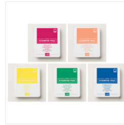
Classic Stampin' Pad Assortment In Color 2018-2020 - 147153