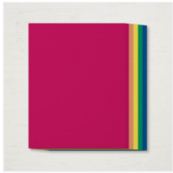
In Color 2018-2020 8-1/2" X 11" Cardstock - 146973