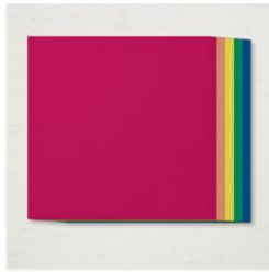
In Color 2018-2020 12" X 12" (30.5 X 30.5 Cm) Cardstock - 146974