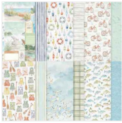
Waterside Retreat 12" X 12" (30.5 X 30.5 Cm) Designer Series Paper - 167920