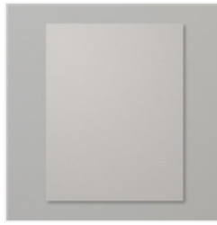
Gray Granite 8- 1/2" X 11" Cardstock - 146983