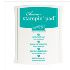
Bermuda Bay Classic Stampin' Pad - 131171