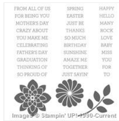
Crazy About You Photopolymer Stamp Set - 137137