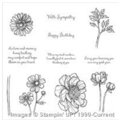
Bloom With Hope Clear-Mount Stamp Set - 133952