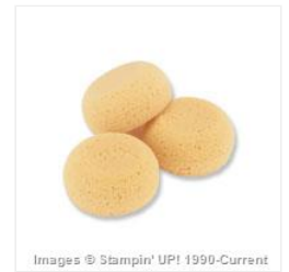
Stamping Sponges - 101610