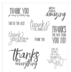
All Things Thanks Wood-Mount Stamp Set - 143089