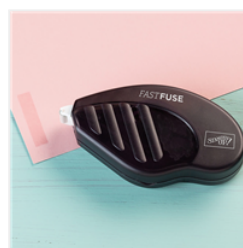
Fast Fuse Adhesive - 129026