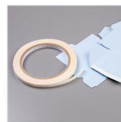
Tear & Tape Adhesive - 138995