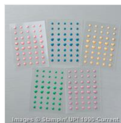
2016-2018 In Color Enamel Shapes - 141410