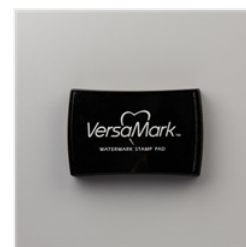
VersaMark Pad - 102283