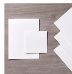
Whisper White 8-1/2" X 11" Thick Cardstock - 140272