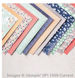
Carried Away Designer Series Paper - 143608