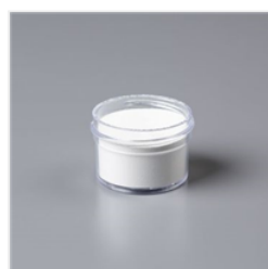
White Stampin' Emboss Powder - 109132