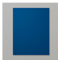
Night Of Navy 8-1/2" X 11" Cardstock - 100867