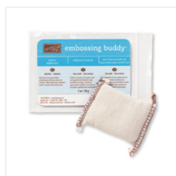
Embossing Buddy - 103083