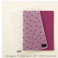
Sparkle Textured Impressions Embossing Folder - 147356 Price: $0.00