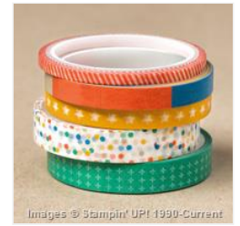
Party Animal Designer Washi Tape - 147362 Price: $0.00