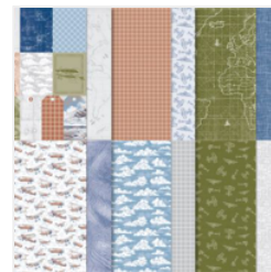
Take To The Sky 12\" X 12\" (30.5 X 30.5 Cm) Designer Series Paper - 163436