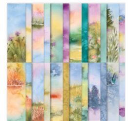
Thoughtful Journey 6\" X 6\" (15.2 X 15.2 Cm) Designer Series Paper - 163303