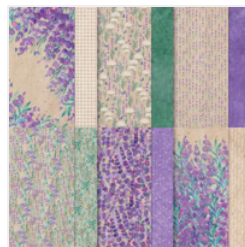
Perennial Lavender 12\" X 12\" (30.5 X 30.5 Cm) Designer Series Paper - 162593