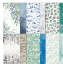
Winter Meadow 12\" X 12\" (30.5 X 30.5 Cm) Designer Series Paper - 162133