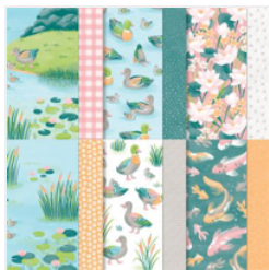
Lily Pond Lane 6\" X 6\" (15.2 X 15.2 Cm) Designer Series Paper - 163342