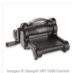
Big Shot - 113439