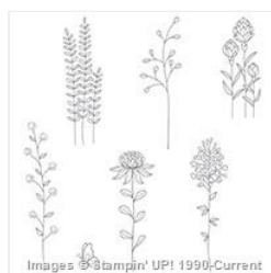
Flowering Fields Wood-Mount Stamp Set - 141300