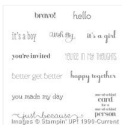
A Dozen Thoughts Clear-Mount Stamp Set - 131059