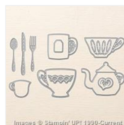
Cups & Kettle Framelits Dies - 140624