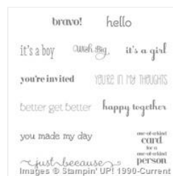
A Dozen Thoughts Wood-Mount Stamp Set - 131056