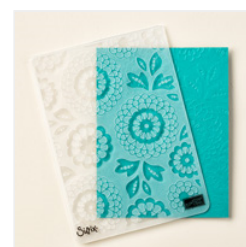
Lovely Lace Textured Impressions Embossing Folder - 133737