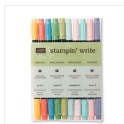
Subtles Stampin' Write Markers - 131263