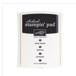
Basic Black Archival Stampin' Pad - 140931