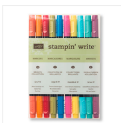
Brights Stampin' Write Markers - 131259