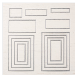
Stitched Rectangle Dies - 148551