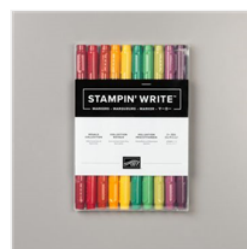
Regals Stampin' Write Markers - 147155