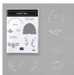
Honey Bee Bundle - 153792