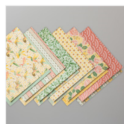
Mosaic Mood Specialty Designer Series Paper - 149478