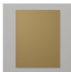
Soft Suede 8-1/2" X 11" Cardstock - 115318