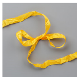
Crushed Curry 3/8" (1 Cm) Crinkled Seam Binding Ribbon - 149444