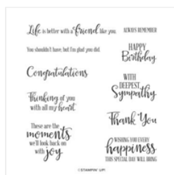
Peaceful Moments Cling Stamp Set (En) - 151595