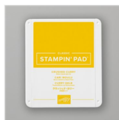
Crushed Curry Classic Stampin' Pad - 147087