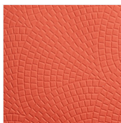
Mosaic 3D Embossing Folder - 149575