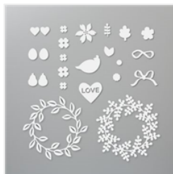
Stanzformen Schmück Den Kranz - 152722