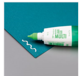
Mehrzweck- Flüssigkleber - 154974