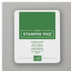
Klassisches Stempelkissen In Gartengrün - 147089