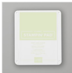
Klassisches Stempelkissen In Lindgrün - 147102