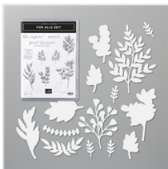
Produktpaket Für Alle Zeit (Deutsch) - 154096