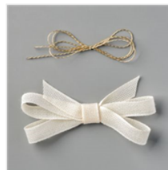
Faden Und Dekoband Im Kombipack Ewiges Grün - 152475