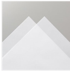
Pergament - 106584