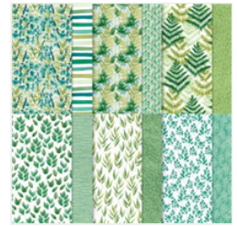
Designerpapier Ewiges Grün - 152492