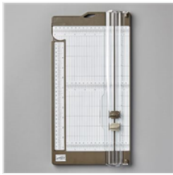
Paperschneidemaschine Farbkarton A4 - 152392