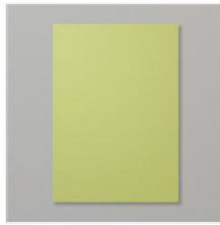
Farbkarton A4 Farngrün - 131290