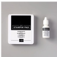
Stempelkissen Ohne Tinte Und Nachfülltinte In Flüsterweiss - 147277