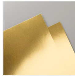
Metallic- Folienpapier In Gold - 132622