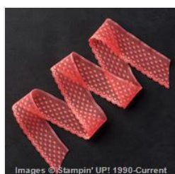
Watermelon Wonder 1" Dotted Lace Trim - 138425 Price: $6.00