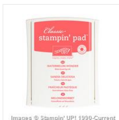
Watermelon Wonder Classic Stampin' Pad - 138323 Price: $6.50