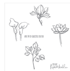
Remarkable You Wood-Mount Stamp Set - 139891 Price: $45.00