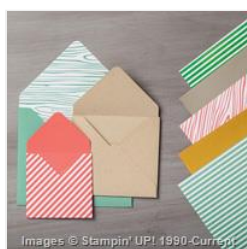
2015-2017 In Color Envelope Paper (Stripes) - 138312 Price: $6.00