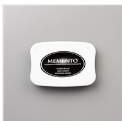
Tuxedo Black Memento Ink Pad - 132708 Price: $8.00