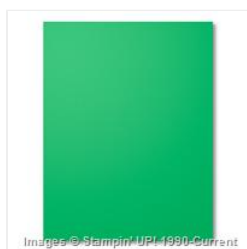
Cucumber Crush 8-1/2" X 11" Cardstock - 138335 Price: $8.00