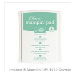
Mint Macaron Classic Stampin' Pad - 138326 Price: $6.50