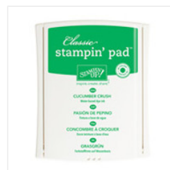
Cucumber Crush Classic Stampin' Pad - 138324 Price: $6.50