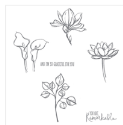
Remarkable You Clear-Mount Stamp Set - 139894 Price: $33.00