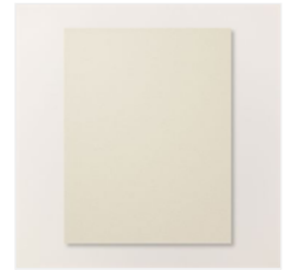
Basic Beige 8-1/2"