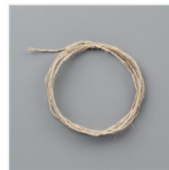
Linen Thread -