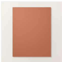
Copper Clay 8-1/2"