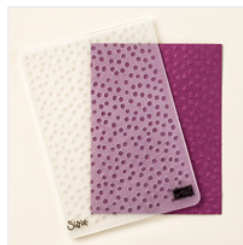
Decorative Dots Textured Impressions Embossing Folder - 133520