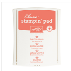
Calypso Coral Classic Stampin' Pad - 126983