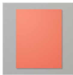
Calypso Coral 8-1/2" X 11" Cardstock - 122925