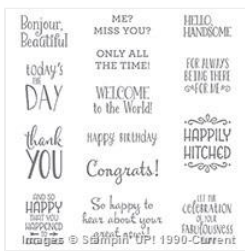
Happy Happenings Wood-Mount Stamp Set - 138734

stampswellwithothers@gmail.com http://donnas-stampswellwithothers.blogspot.com/