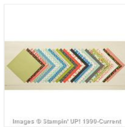
Pretty Petals Designer Series Paper Stack - 138442