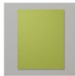
Old Olive 8-1/2" X 11" Cardstock - 100702