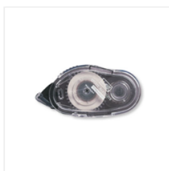
Snail Adhesive - 104332