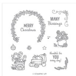
Many Blessings Photopolymer Stamp Set - 147775

stampingwithmore@gmail.com http://www.stampingwithmore.com