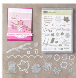
Colorful Seasons Photopolymer Bundle - 145348