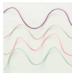
Nature's Twine - 146342